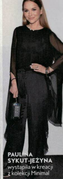
PAULINA SYKUT-JEZYNA wystąpiła w kreacji z kolekcji Minimal.