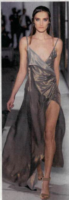
W kolekcji Under Pressure dominują jedwabne musliny, delikatne tiule, żorzety, szyfony i organzy.